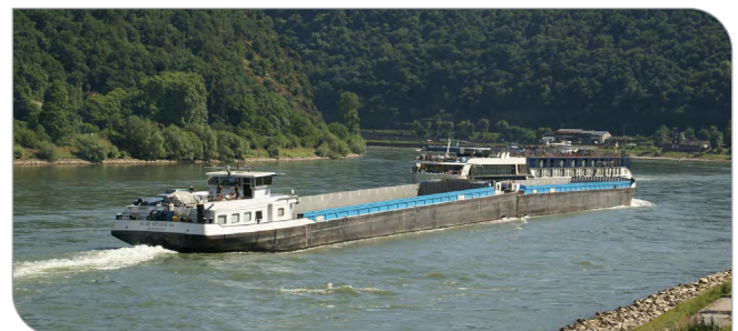
Ob Automobil-, Schiffs- oder Bahnverkehr: CO 2 -Emissionen aus fossilen Brennstoffen tragen maßgeblich zum Klimawandel bei. „reFuels“ erforscht regenerative Kraftstoffe – völlig CO 2 -neutral bei gleicher Energiedichte.